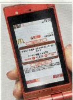
マクドナルドは毎週割引クーポンを配信

マクドナルドは毎週金曜日に割引クーポンを配信するサービス。受取った消費者は携帯の画面を店頭で見せたり、読み取り端末にかざしたりするとサービスを受けられる。会員の属性や購入履歴などを容易に把握できるため、年齢別などきめ細かく販促活動を行う。09年に比べて4割減ら